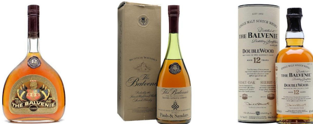
Bild: The Balvenie „Classic 12“ und der Founder’s Reserve in der alten Ausstattung (links) und der Balvenie 12 - DoubleWood im Design seit 1993 (Bild rechts).

Aus dem Jahr 1993 stammen auch die ersten mir bekannten Bottle Codes.