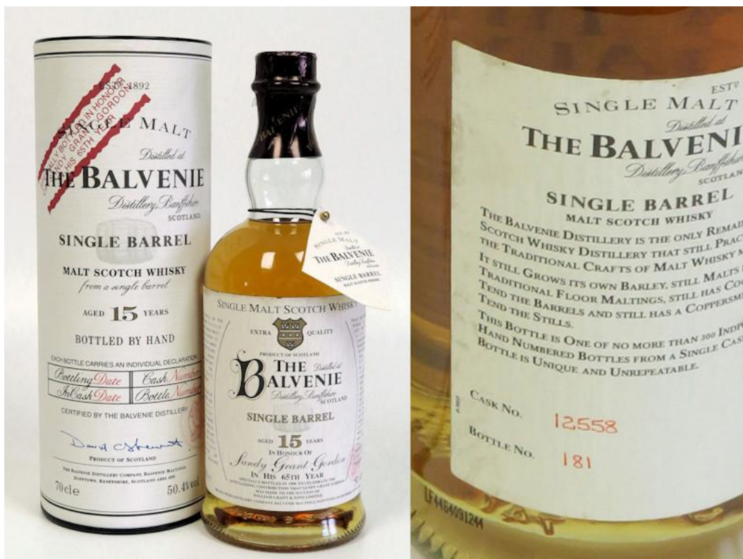
Bild: Eine ganz besondere Flasche Balvenie Single Barrel 15 Jahre. Der aufgedruckte Bottle-Code ist auf dem rechten Bild ganz unten links am Glasboden deutlich zu sehen.